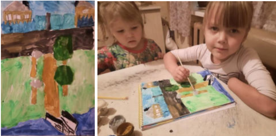
Проект ППМИ 2022г. «Обустройство пешеходной зоны в д. Можары», дети рисуют пешеходную зону.

Так же на Центральной улице находятся все объекты, необходимые комфортному проживанию в деревне. К ним относятся ФАП, сельский клуб, детский сад, автобусная остановка и магазины. Что крайне недостаточно и вызывают большие нарекания, и претензии у жителей села. В направлении центра ежедневно по дороге ул. Труда проходит не менее 70% от населения, большинство из них - дети. Опрос проведенный среди жителей села показал, что устройство дорожки способно кардинально улучшить ситуацию, создаст условия для комфортного и безопасного передвижения.