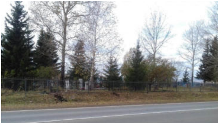
Обустройство территории кладбища в д. Косые Ложки, проект ППМИ 2021г.