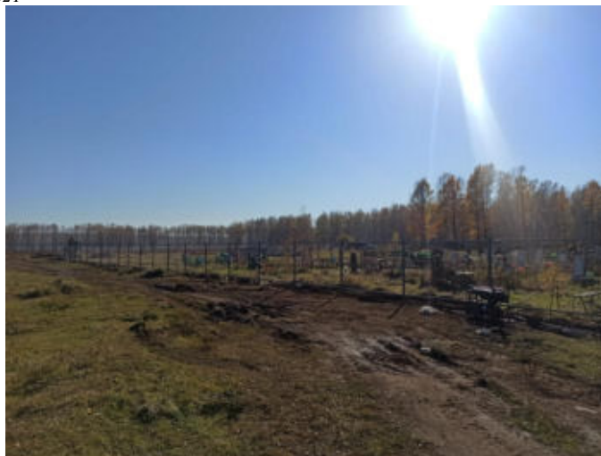
Обустройство территории кладбища в с.Ивановка, проект ППМИ 2021г.