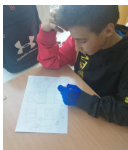
Семейный парк глазами детей: моделирование, и рисунки в поддержку проекта; Проект ППМИ «Благоустройство территории семейного парка для отдыха и занятия спортом в с.Родники», 2022г.

5. Шушенское территориальное подразделение представит проект «Обустройство пешеходной зоны д. Можары». Данный участок находится в той части села, где проходит основной поток школьников, детей дошкольного возраста, идущих в школу, детский сад, а также их родителей. Дети вынуждены ходить утром в школу в полной темноте по траве и грязи.