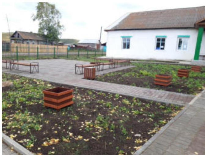
Благоустройство территории сельского клуба в с. Темра, проект ППМИ 2021