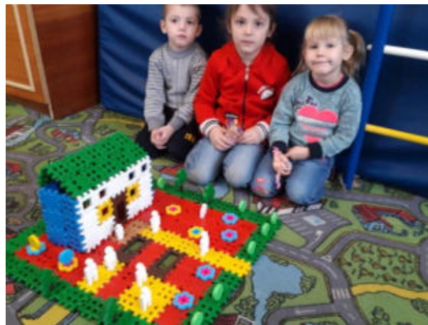
Инициативная группа с. Темра, информационный стенд, «новый клуб глазами детей», проект ППМИ «Ремонт сельского клуба с. Темра», 2022г.

4. Родниковское территориальное подразделение представит на конкурс проект «Благоустройство территории семейного парка для отдыха и занятия спортом в с. Родники». 80% населения поддержали проект, который подразумевает строительство и благоустройство площадки для семейного отдыха, с организацией зоны игр и развлечений для детей и зоны отдыха для взрослых, с установкой спортивных снарядов для занятий физкультурой и спортом. Место уже определено по ул. Октябрьская, по периметру территории высажены ранее молодые деревья, в центре будет установлен развивающий детский комплекс, несколько видов качелей, карусель для охвата разновозрастных детей. Кроме того планируется установить лавочки и урны, разбить клумбы и огородить площадку бордюром из камня.