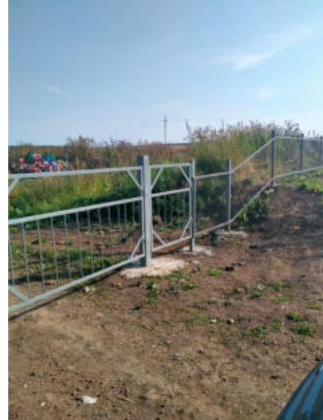
Обустройство территории кладбища в с. Березовское, проект ППМИ 2021г.