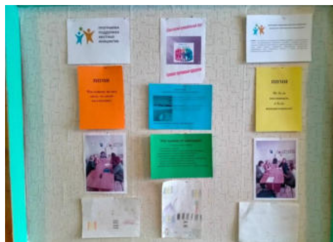
Собрание жителей в д. Ершово, информационный стенд, проект ППМИ «Обустройство пешеходной зоны в д.Ершово», 2022г.

3. В Холмогорском территориальном подразделении запланирован проект «Ремонт сельского клуба с. Темра». Инициативная группа села сочла логичным, что в 2022 году нужно заменить кровлю здания клуба и жители единогласно приняли решение ещё раз поучаствовать в ППМИ. 3 декабря состоялось итоговое собрание жителей села, на котором большинство голосов было отдано за проект «Ремонт кровли сельского дома культуры». Реализация проекта очень значима для темринцев, ведь клуб это «сердце» села, именно здесь встречаются все поколения и переживают вместе все значимые события года.