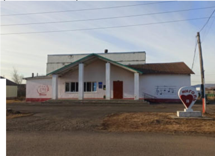
Текущее состояние сельского клуба, проект ППМИ «Ремонт сельского клуба в п. Инголь», 2022г.

1. от Ивановского территориального подразделения – будет заявлен проект «Ремонт сельского клуба п. Инголь. Почему объектом внимания общественности единогласно определено здание сельского клуба в п. Инголь? Само здание 1975 года постройки, находится в неудовлетворительном состоянии. Реализация проекта позволит обеспечить безопасные и комфортные условия для многочисленных посетителей, а также для самих работников сельского клуба поселка Инголь и жителей соседней деревни Едет. Это раскроет потенциал сельского клуба, как культурно-досугового и образовательно-просветительского центра для посетителей: создаст условия для проведения и организации концертных программ, конкурсов, вечеров отдыха. Сегодня сельский клуб и библиотека очень востребованы в поселке, ежедневно более 20 посетителей приходят обменять литературу, позаниматься в детских и взрослых кружках несмотря на неудобства. В поселке Инголь более 100 детей до 18 лет, для них клуб - это место не только общения и проведения досуга, но и место творческого и культурного развития. Все поселковые собрания и встречи проходят в здании сельского клуба. Поэтому капитальный ремонт кровли и фасада здания сельского клуба п. Инголь на сегодняшний день является главной задачей!