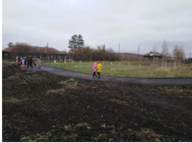
Обустройство спортивной площадки в с.Шушь, проект ППМИ 2021г.

Рост цен на строительные материалы внес в сметы свои коррективы, однако с большим личным участием, энтузиазмом местного населения, представителей общественных организаций и значительного вклада от предпринимательского сектора все проекты были успешно реализованы.